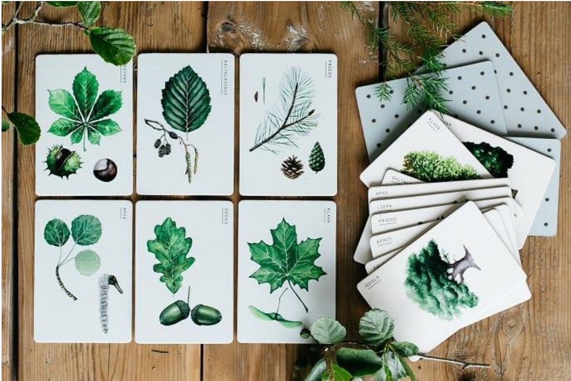
Spēle "Kokotājs".