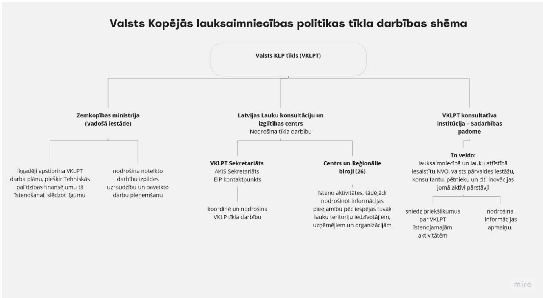
1.attēls Valsts KLP tīkla darbības shēma