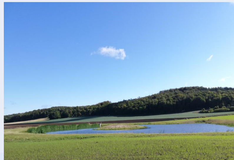
Mitrājs, Zviedrija, 20.09.2022.